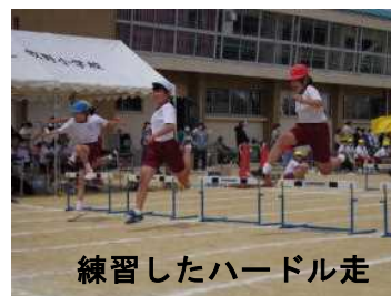
練習したハードル走

一つの目標に向かって練習を重ねた運動会が終わりました。どの子供も仲間と力を合わせて、一生懸命にがんばっていました。精一杯力を出し切った姿は、美しく、感動がありました。まっすぐきれいに伸びようと学び続ける姿から、元気をもらっているのは、私たち大人だと思うのです。これからも安心して学校生活が送れるように、私たちはどんなときも子供たちの応援団であるというメッセージを伝えていきたいものです。