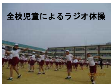
全校児童によるラジオ体操

特別支援学級や通級指導教室では、自立活動という時間を設定しています。特別な支援を受ける場合は、保護者、子供、教師が十分に話し合っ、よりよい方法を探り、学びの場を決定します。自分に合った学びの教室と学年の交流級を行き来しながら、子供たちは、